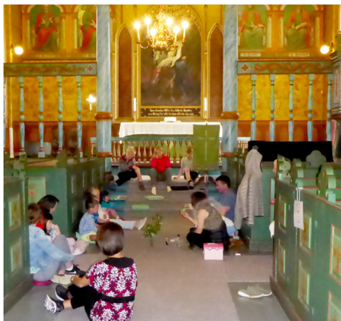
Borna lyttar konsentrert til forteljinga. Munnleg forteljing er kanskje blitt mangelvare i vår mediavid.