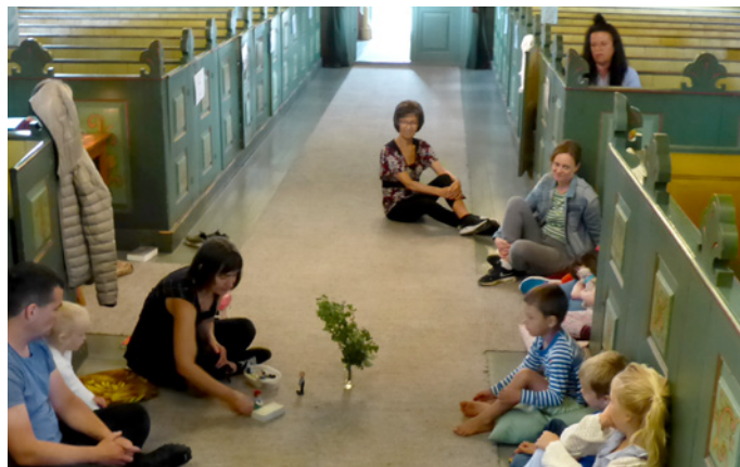
Jorunn fortel om Sakkeus.