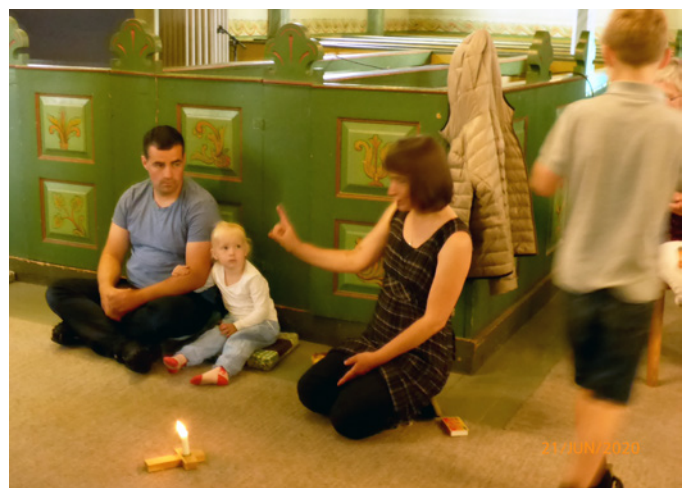
Ein av gutane har tent lys.