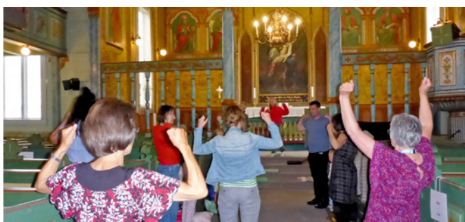
Ein song med rørsler er bra!